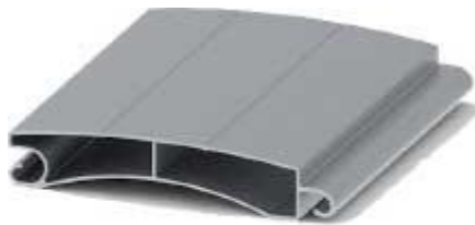
تیغه تک پل