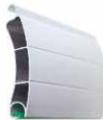
تیغه دو پل