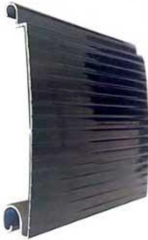
تیغه تک جداره آلومینوم گرگره برقی

در بازار به صورت تک و دو جداره عرضه می‌شود. اما امروزه بالای ۹۰ درصد از تیغه دو جداره آلومینیوم استفاده می‌کنند. علت آن هم امنیت بالا و سرو صدای کم هست.